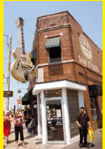
Sun Studios, Memphis