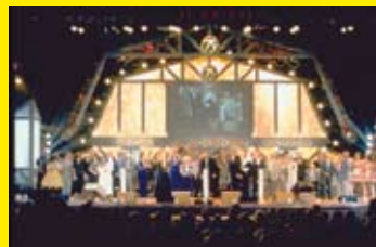
Grand Ole Opry Nashville