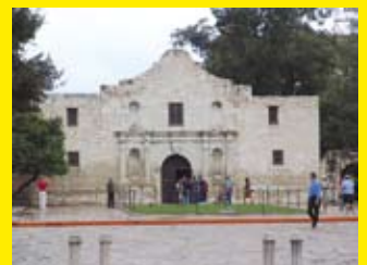
The Alamo, San Antonio